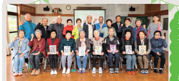
週一元気アップ教室 綱井いきいき体操会の皆さん (国東町綱井)